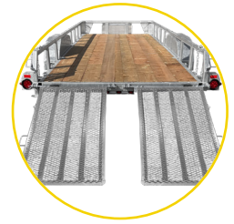
RAMPES AVEC ASSISTANCE À RESSORT